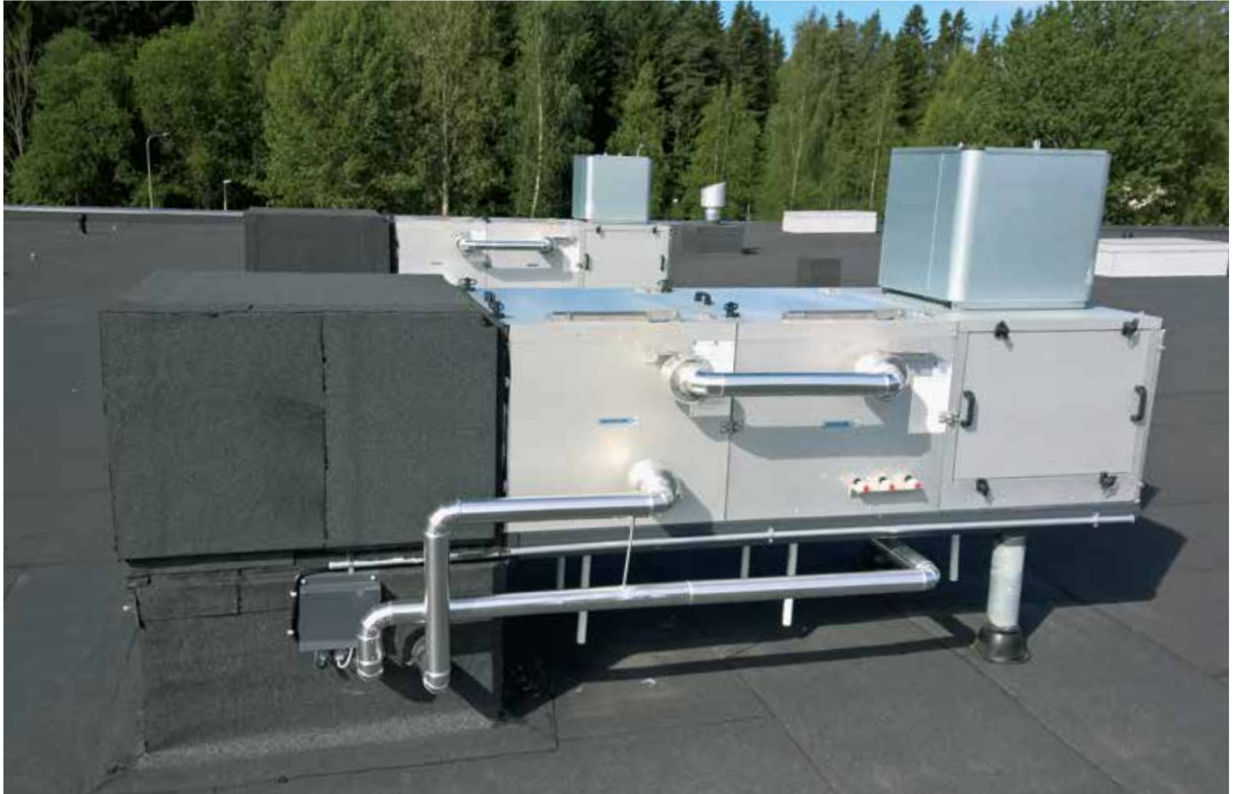
ATEX-luokitellulla poistopuhaltimella varustettu RETCARE OUT E -poistoilmakone asennettuna vesikatolle.

RETCARE OUT E -poistoilmakone valmistetaan kohdekohtaisesti räätälöityihin ulkomittoihin. Myös poistopuhallin valitaan kohteen vaatimusten perusteella. Projektikohtaisista mitoitusdokumenteista löytyvät laitteen tarkat tiedot.