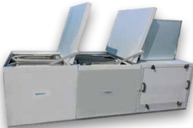
RETCARE OUT E -poistoilmakoneen toiminto-osien huolto tapahtuu osan päällä tai sivulla sijaitsevien huoltoluukkujen kautta.