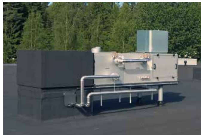
RETCARE OUT E -poistoilmakone asennettuna vesikatolle jalustan päälle.